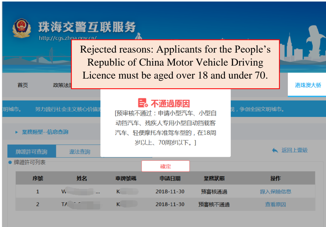
圖 11 Picture 11